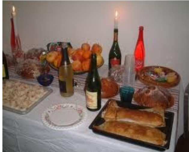
Ofrendas en el altar