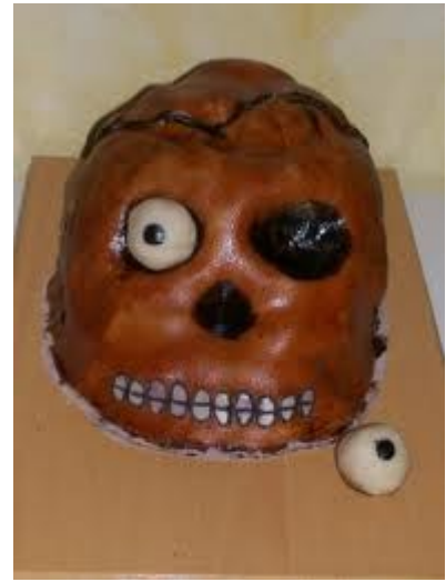
Calaveras en chocolate