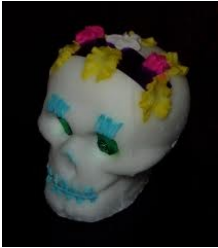
Calaveras en azúcar